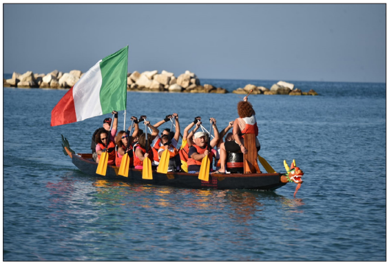
Nel Dragon Boat il singolo non esiste, ognuna sa di essere importante mentre la vittoria è rappresentata dal senso di coesione che solo la squadra riesce ad offrire.

anche le supporter. Sono coloro che non hanno vissuto in prima persona l'esperienza del tumore, ma pagaiano fianco a fianco alle altre. Perché sul drago la carica è la stessa, si è tutte diverse e al tempo stesso tutte uguali. L'unione che si manifesta dentro e fuori la squadra è la chiave di tutto. Sul drago il singolo non esiste, la direzione la danno tutte insieme le atlete pagaiano.