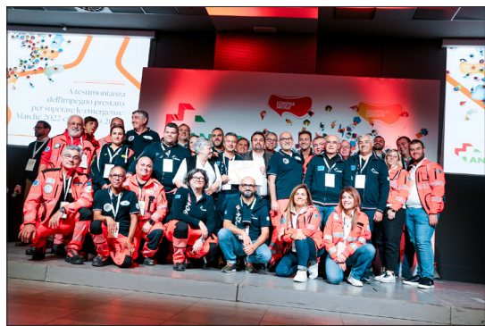
Riccione, 05/11/2023: volontari e dirigenti di ANPAS Marche all'incontro "Convers-Azioni".

Convers-Azioni è stata anche l'occasione per dare i riconoscimenti all'interno del concorso "Idee & Progetti in Rete" che avevano gli obiettivi di stimolare, selezionare e sostenere idee di sviluppo della rete associativa Anpas, promuovendo idee meritevoli già messe in campo dalle pubbliche assistenze replicandole in altri territori. Anpas Marche ha partecipato al concorso con un progetto premiato con il secondo posto, denominato "LifeGenZ" che aveva l'obiettivo di formare quante più persone possibili fin dalla giovane età alla pratica delle manovre di primo soccorso. Realizzato in collaborazione con i