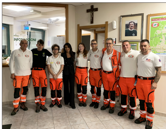
Sede della Croce Verde; la giornalista incontra i volontari.

Direttore responsabile GIUSEPPE MORESCHINI Editore Pubblica Assistenza CROCE VERDE OdV - Porto Sant'Elpidio Sede Via del Palo, 10 - 63821 (FM) - Casa del Volontariato mail segreteria@croceverdepse.org Direttore Dott. Ezio Montevidoni Redazione Francesco Brugnoli - Alberto Damen - Vittorio Cangini Collaboratori Emanuela Astolfi - Alice Censi - Leonardo Caggianelli Paola Corradini - Alex Ferracuti Stampa: Tipolitografia Cognigni - Porto S.Elpidio (FM) - Via Cavour n°6 Tiratura: 7.000 copie finito di stampare: 30 Novembre 2023 Registrazione Tribunale di Fermo n°1-1988 del 26/02/1988