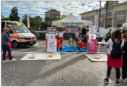
Volontari in Piazza Garibaldi per l'iniziativa Viva.

Una parte fondamentale della dimostrazione ha riguardato l'introduzione dei defibrillatori semi-automatici esterni